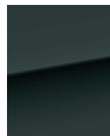
Черная жемчужина 676