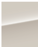
Серый базальт 242